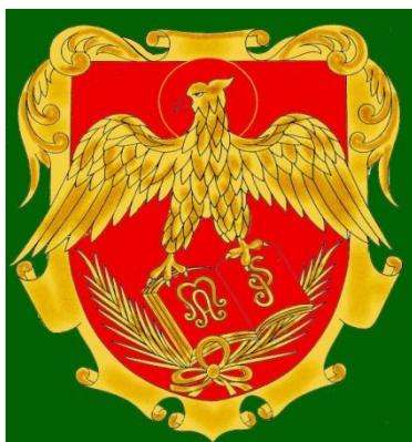
Emblema de la Hermandad