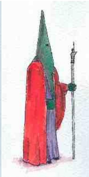
Hermanos Mayores y Representantes