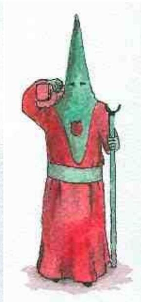
Hermanos Banceros, Capataz y Cereros