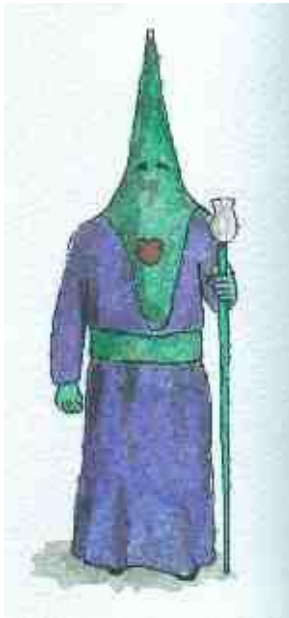
Hermano de Tulipa