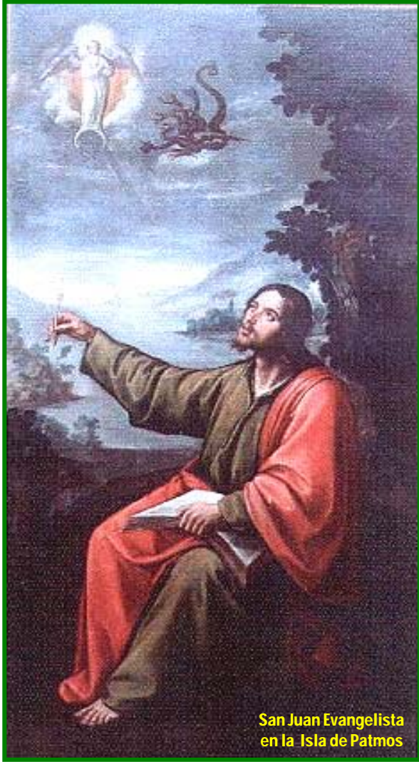
San Juan Evangelista en la Isla de Patmos